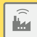
ГУДКИ ПРЕДПРИЯТИЙ И ТРАНСПОРТНЫХ СРЕДСТВ